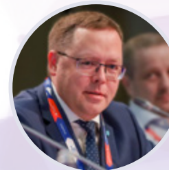
Андрей Карпов Председатель правления Российской Ассоциации экспертов рынка ритейла