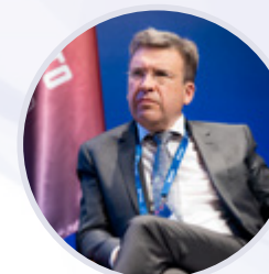
Владлен Максимов Президент Ассоциации малоформатной торговли России