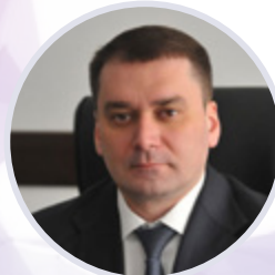
Алексей Гусев Министр торговли и услуг Республики Башкортостан